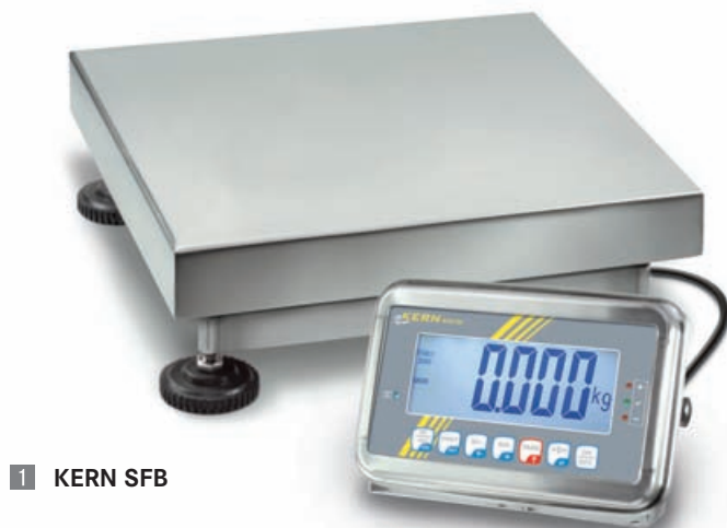
1 KERN SFB