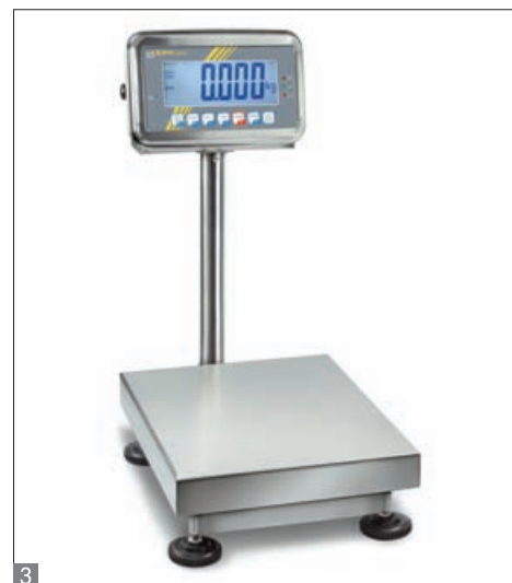
3 KERN SFB-H

Balance plateforme en acier inoxydable avec classe de protection IP65, également avec plateforme XL ou approbation d'homologation [M]